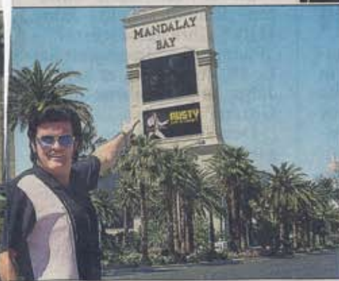
„Mandalay Bay“-Hotel in Las Vegas auf